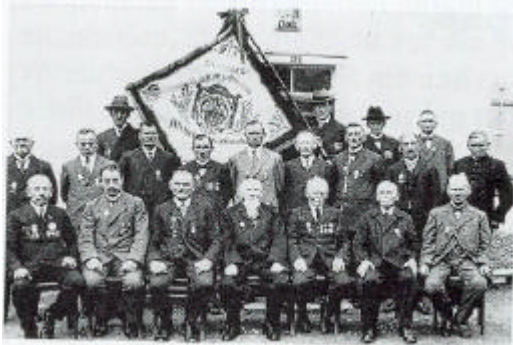
Der Veteranen- und Militärverein mit seiner neuen Fahne im Jahre 1933.