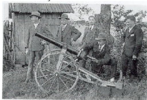
Der Brauch des „Fronleichnamsschießens“ gibt es heute noch in Alheim.

1927 gründete der damalige Veteranen- und Militärverein Alheim-Waldhausen eine Kleinkaliber-Schützenabteilung. Mit großen Opfern an Zeit und Geld wurde in der Gemeindekiesgrube an der Straße nach Waldhausen eine Schießanlage gebaut und im Frühjahr 1928 eröffnet.