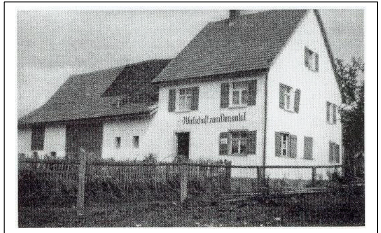
Fotos: Protokoll und Bild vom früheren Gasthaus