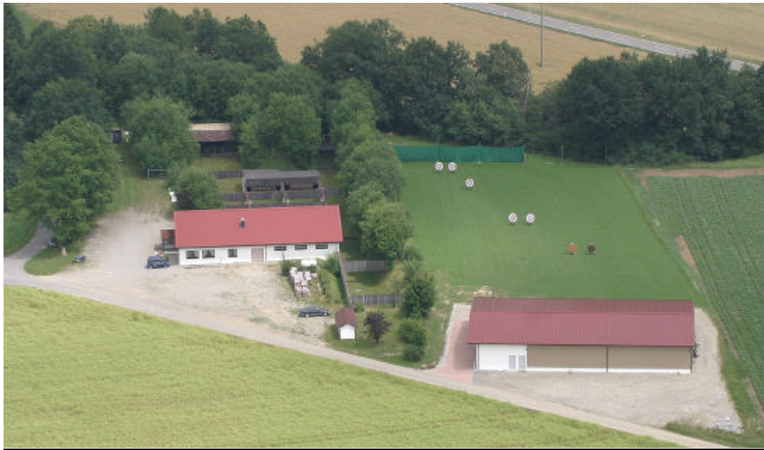
Foto: Schützenhaus links mit Bogenhalle rechts